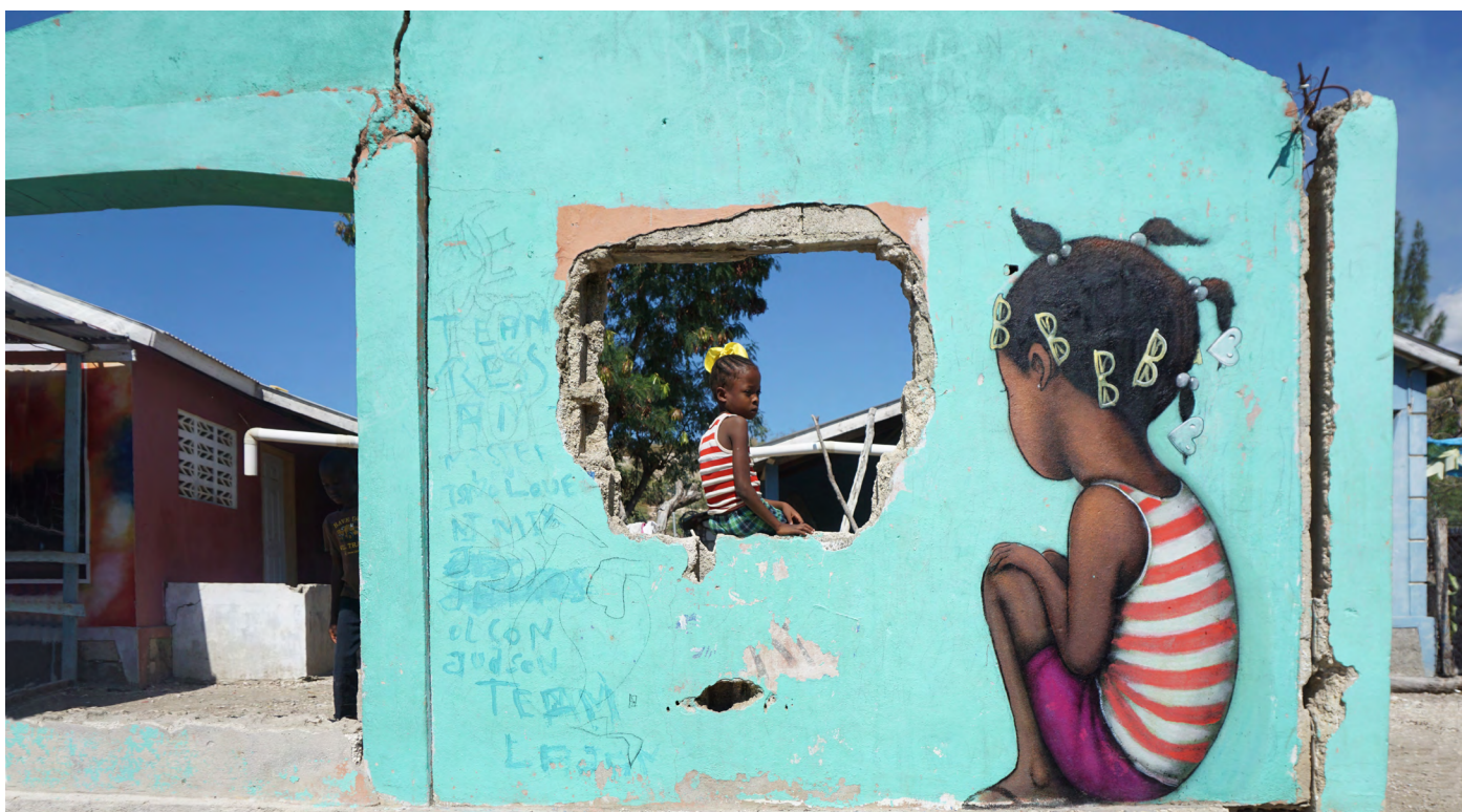
Ravine Sèche, Haïti, 2019 © Seth

Cette rétrospective photographique est la première de l'artiste globe-trotter Seth, à Paris. De la Chine à Tahiti, en passant par l'Ukraine ou le Sénégal, Seth nous offre un tour de la planète en couleur où street-art rime avec dépaysement et rencontre de l'autre.