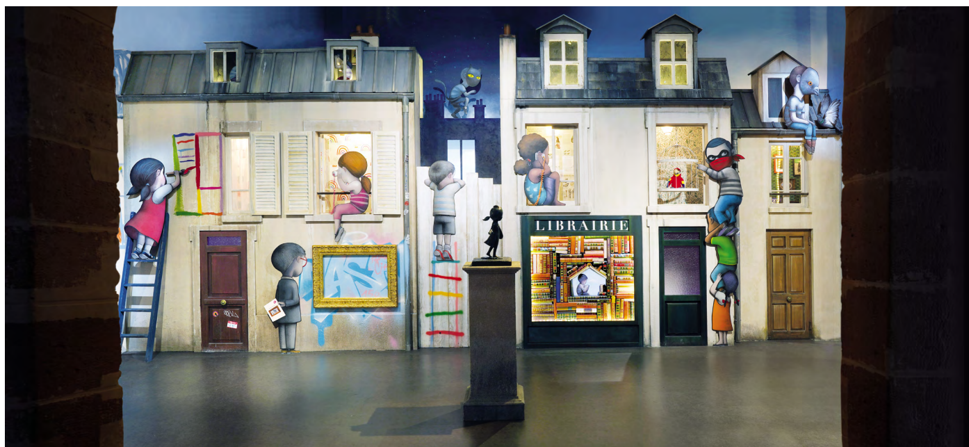
Exposition SETH se la JOUE au Musée en Herbe, 2023 © Seth

Avec 37 000 visiteurs à son compteur, l'exposition «SETH se la JOUE» continue à battre son plein. À l'occasion de l'invasion du quartier du Louvre par l'artiste, Le Musée en Herbe propose un jeu de piste disponible à l'accueil du Musée en Herbe. Il permettra aux visiteurs, par le biais du jeu, de prolonger leur visite en allant découvrir la sculpture «Jusqu'au ciel» et terminer par l'exposition «Seth Globe-Painter» au Carrousel du Louvre.